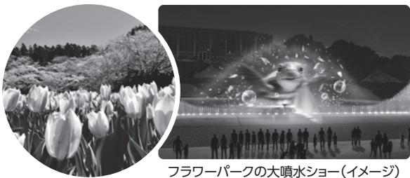
フラワーパークの大噴水ショー(イメージ)

キッチンカーなどで提供される花と地元食材をテーマとした特別メニューや、市民などが参加するショーやイベント、地元企業の出展なども見どころとなっています。花と緑とデジタルの祭典、浜名湖花博2024へお越しください!