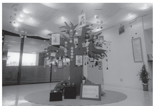
染めた布で空を表現し、2.3mの土台には切り絵や写真などを展示