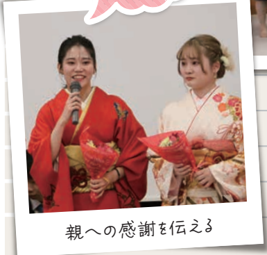
親への感謝を伝える